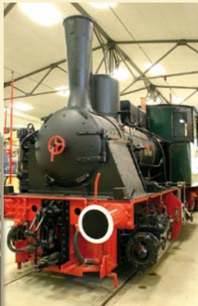
Historische Fahrzeuge, Entwicklung des Öffentlichen Personennahverkehrs in Frankfurt am Main und Umgebung